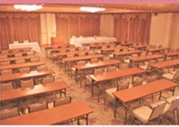
コの字・口の字・相向かい等