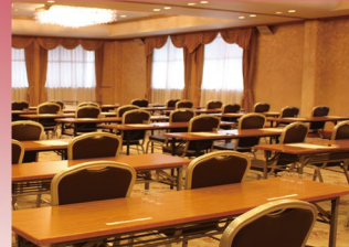
会議室一例 (学校形式)